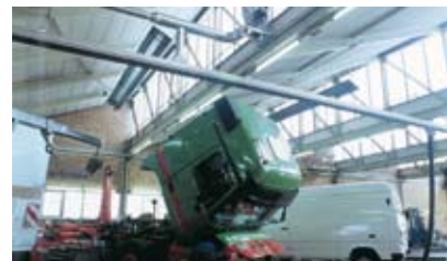
PKW & LKW Werkstätten