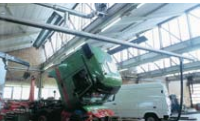
PKW & LKW Werkstätten