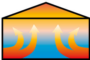
Bei herkömmlichen Heizungen zieht die erwärmte Luft nach oben aus dem nutzbaren Bereich heraus.

Behagliche Wärme wird dort erzeugt, wo man sie braucht - im Aufenthaltsbereich. Ungewollte und teure Luftpolster unter der Hallendecke sowie Transmissions- und Lüftungsverluste gehören somit der Vergangenheit an.